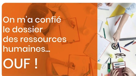
Table RH pour non RH

Vous n'avez pas de professionnels RH, cette formation est pour vous!